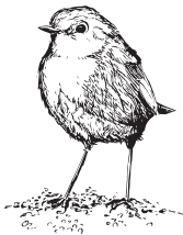
Le Rouge Gorge